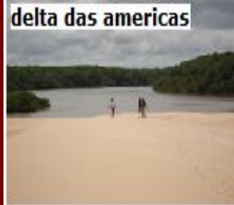
delta das americas